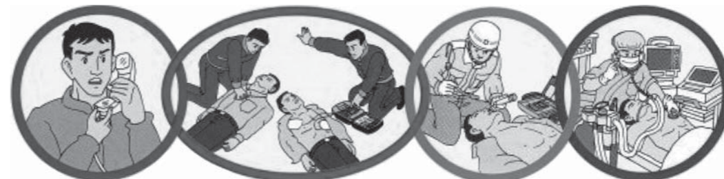
早い119番通報 おちついて、はっきりと119番に通報する 早い応急処置 救急車到着前の早い心肺蘇生と早い除細動 早い救急処置 救急救命士等の行う高度な救急処置 早い医療処置 医療機関における医療処置

左の図は 命 のリレーと言われ、重症の患者さんを救命する為に大変重要な流れです。このうちどれか一つでも欠けてしまうと大切な命を救うチャンスは少なくなってしまいます。